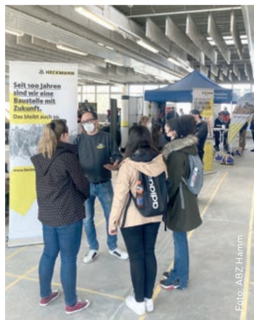
Schülerinnen sprachen mit den Firmenvertretern über die angebotenen Ausbildungsplätze.