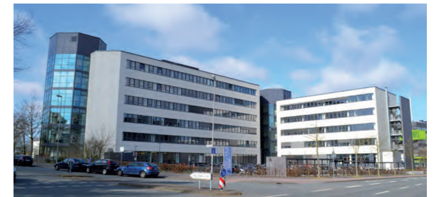
Fachhochschulzentrum der FH Münster

Der LL.M. ist ein international anerkannter aufbauender Abschluss für Juristen sowie für Berufstätige anderer Fachrichtungen, die in einem spezialisierten rechtlichen Bereich arbeiten möchten.